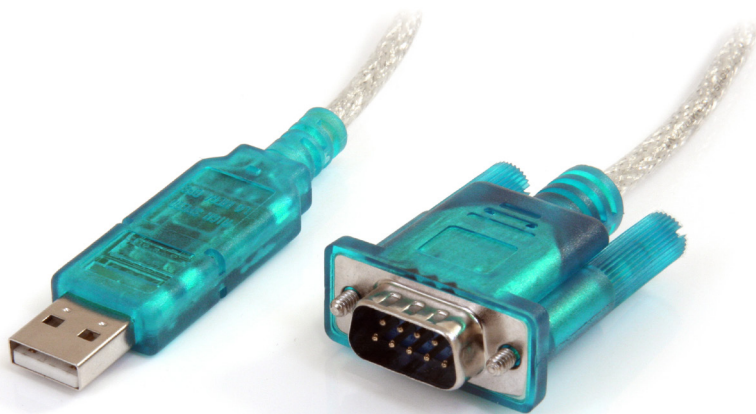
*実際の製品は写真と異なる場合があります。